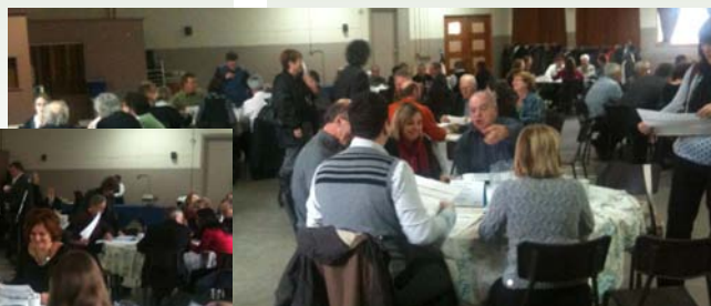
Discussion en atelier le 24 novembre dernier

Rassemblement populaire le samedi 5 mai aux Promenades de Sorel La semaine se terminera avec un grand rassemblement aux Promenades de Sorel le samedi 5 mai où toute la population sera invitée à s'impliquer dans leur milieu et à prendre connaissance des projets ou initiatives qui se font sur le territoire.